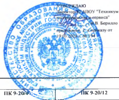
График проведения промежуточной аттестации на II семестр 2023-2024 учебного года профессии 43.01.01 Официант, бармен, 43.01.01 Повар, кондитер