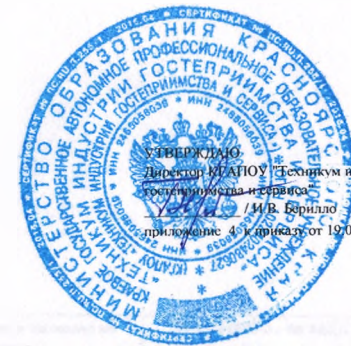
График проведения промежуточной аттестации на II семестр 2023-2024 учебного года профессии 43.01.01 Официант, бармен, 43.01.01 Повар, кондитер