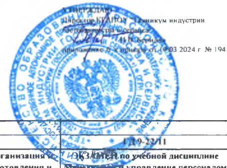
График проведения промежуточной аттестации на II семестр 2023-2024 учебного года специальности 43.02.15 Поварское и кондитерское дело, 43.02.14 Гостиничное дело